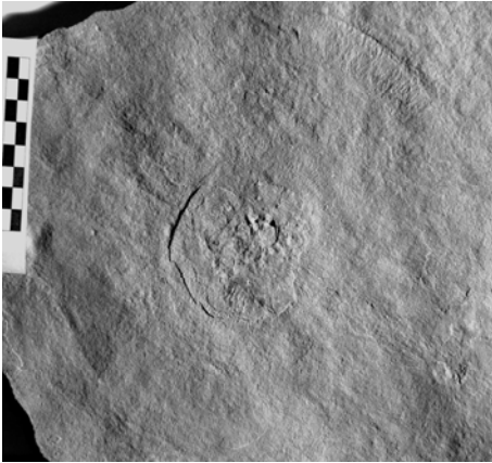
Рис. 1. Cyclomedusa sp. nov.

местонахождения, где добыто большое количество новых образцов, преимущественно из верхней и нижней частей разреза. Эти сборы во многом повторяют уже найденные ранее. Кроме того, нам удалось обнаружить новые формы, особенно интересные найдены в нижней части разреза (могилев-подольская свита). Среди этих новых форм особенно выразительны следующие открытия: (1) отпечатки крупных в диаметре и почти незаметных в рельефе медузоидов типа Cyclomedusa (рис. 1); (2) «ядра» полипов, у которых сохранились объемные следы мезентериальных (?) складок. Еще преждевременно делать их квалифицированное монографическое описание из-за небольшого числа экземпляров, которые не вызывают у нас сомнения (рис. 2). Здесь мы приводим первые изображения этих форм, полные описания которых будут сделаны нами в профессиональном издании.